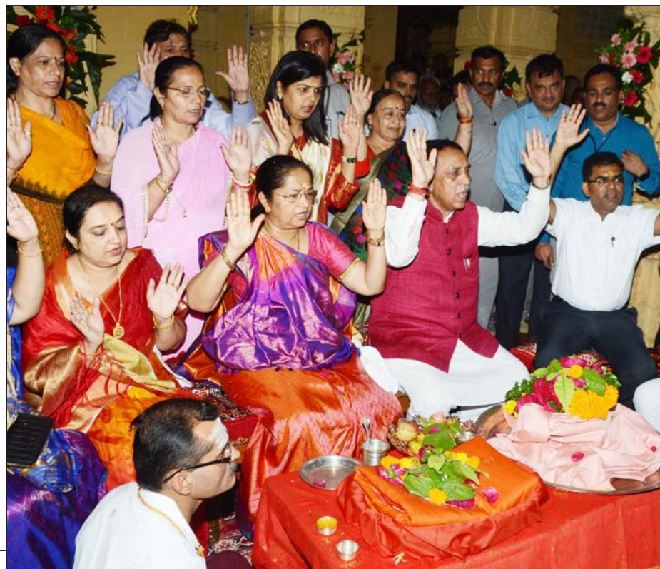
State CM Vijay Rupani with his wife performs pooja at Somnath Temple.