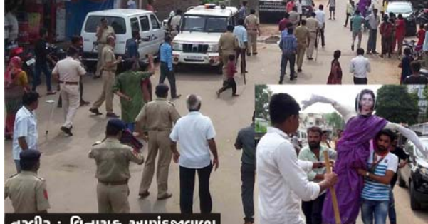
રાજીનામું આપેલ પ્રમુખના પૂતળા દહનનો કાર્યક્રમ યોજાયો

પેટલાદ નગરપાલિકામાં છેલ્લા ઘણાં મહિનાઓથી સત્તાની સાંઠમારી ચાલી રહી છે. પાલિકાની સત્તા ટકાવી રાખવા કોંગ્રેસ દ્વારા એડી ચોટીનું જોર લગાવી રહ્યા છે. જ્યારે ભાજપ યેનકેન પ્રકારે પાલિકાની સત્તા કોંગ્રેસ પાસેથી છીનવી લેવા માંગે છે. થોડા સમય અગાઉ પાલિકાના પ્રમુખ અને ઉપપ્રમુખ વિરુદ્ધ અવિશ્વાસની દરખાસ્ત રજૂ કરવામાં આવી હતી. જેનો મામલો ડાઈકોર્ટ સુધી પહોંચ્યો હતો. પરંતુ, તાજેતરમાં કોંગ્રેસના મહિલા પ્રમુખ અચાનક રાજીનામું ધરી દેતા આ સમગ્ર ઘટનામાં નાટ્યાત્મક વળાંક આવ્યો હતો. આ સમગ્ર ઘટનાને લઈ સ્થાનિક રાજકારણમાં ગરમાવો આવવા સાથે એક પ્રકારના તર્કવિતર્કો શરૂ થઈ ગયા હતા. જેથી આજરોજ રાજીનામું આપેલ પ્રમુખ વિરુદ્ધ તેમના જ વોર્ડમાં તેમના પૂતળા દહનનો કાર્યક્રમ કોંગ્રેસ દ્વારા કરવામાં આવ્યો હતો. ઉત્તરતંત્ર, તેઓ વિરુદ્ધ સૂચોચારો કરી વિરોધ પ્રદર્શિત કરવા સાથે દેખાવો પણ કર્યાં હતા.